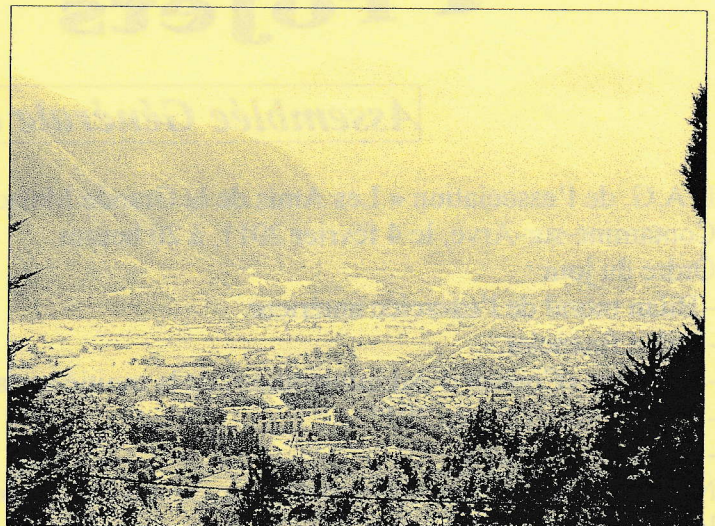
~ Quel panorama ! ~