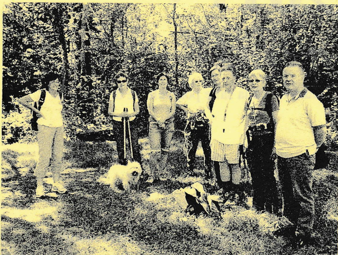
~ Une petite halte ~

Elles sont revenues un peu fatiguées, mais enchantées, par cette promenade de santé.